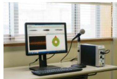
3号館4F／ボイスプロフィール分析装置