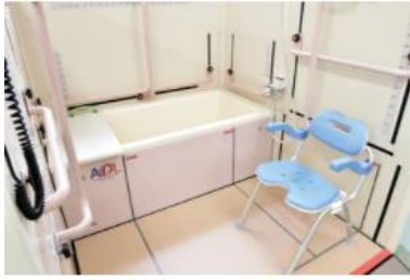
4号館2F / ADL入浴シミュレータ