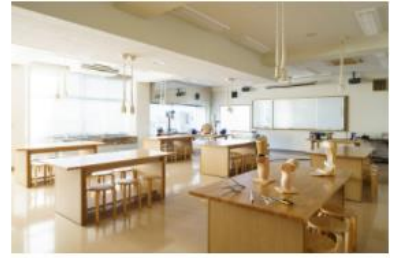
4号館1F / 義肢装具実習室

各ユニットはスイッチひとつで高低調節可能。また移動式で配置換えができ、訓練やテストが効果的に行われるような配慮がされています。