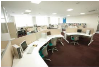
5号館6F / 大学院生研究室

大学院生研究室は24時間セキュリティシステムに守られ、平日夜間や休日を問わず安全かつ快適な環境で自由に学修・研究することができます。