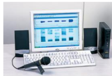
3号館4F／音響分析装置

リハビリテーション学部言語聴覚学科の講義や実習に使用。奥に5つの検査室・訓練室があり、中の様子をこの部屋から観察し、検査・訓練の実際について学びます。