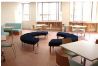
5号館2F / 学生ラウンジ

学生の皆さんがリラックスして利用できるようドーナツ型のユニークなソファやボックス席等を配置しています。手洗い場や自動販売機、給湯器等も完備しており、ランチタイムに使用することもできます。