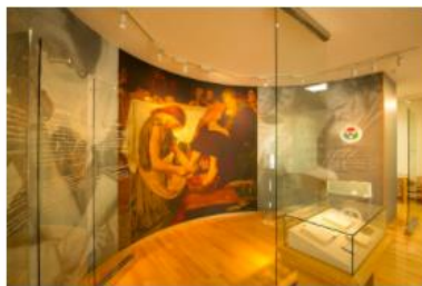
5号館1F / 聖隷歴史資料館

学生の皆さんがリラックスして利用できるようドーナツ型のユニークなソファやボックス席等を配置しています。手洗い場や自動販売機、給湯器等も完備しており、ランチタイムに使用することもできます。