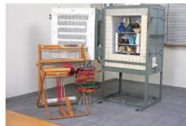
3号館2F／織り器・電気窯

電気炉、電動ろくろ、ポール盤、織機などが設置され、作業療法に必要な陶芸や木工、織物、各種手工芸の技法を学びます。