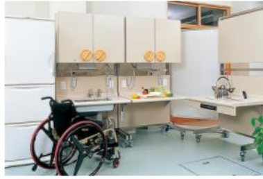
4号館2F / トレーニングキッチン

各ユニットはスイッチひとつで高低調節可能。また移動式で配置換えができ、訓練やテストが効果的に行われるような配慮がされています。