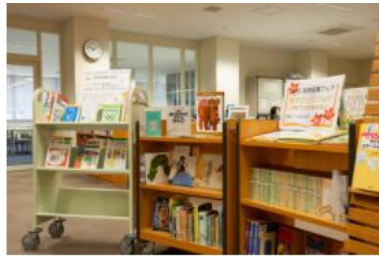
5号館2F・3F / 図書館

大学院生研究室は24時間セキュリティシステムに守られ、平日夜間や休日を問わず安全かつ快適な環境で自由に学修・研究することができます。