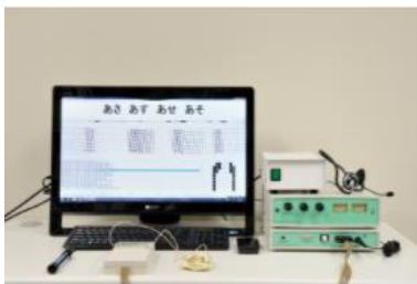
3号館4F／エレクトロパラトグラフィ (EPG)