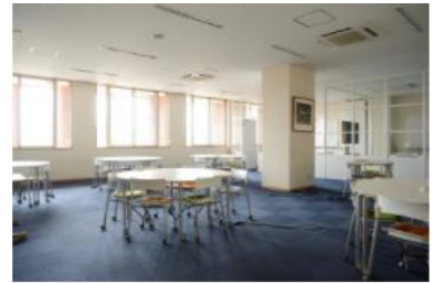
5号館2F / ラーニングcommons

保健医療福祉分野を中心に、図書館の蔵書は約11.7万冊。所蔵資料は、図書館ホームページで検索可能です。個別ブースの視聴覚コーナーやパソコンも完備しています。