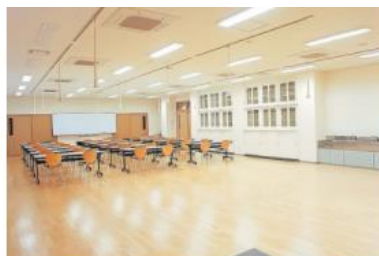
3号館2F／作業技術学実習室

全部で20室あります。特にリハビリテーション学部作業療法学科ではProblem-based Learning (PBL) によるチュートリアル方式での授業を中心に使用します。