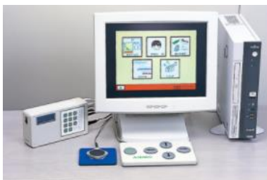
3号館4F／失語症訓練装置