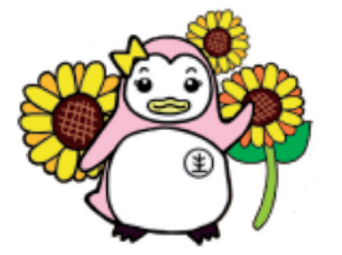
更生ペンギンのサラちゃん

社会復帰調整官は、全国の保護観察所に配置されている専門職です。私たちは、医療観察制度の対象となった人が安心して地域で暮らせるようにかかわります。この制度は、精神疾患の影響によって大きな事件を起こした人が、その病気を治療しながら社会に復帰していくことを支える仕組みです。対象となる人の障害や生きづらさ、事件に至った背景等を理解し、再び社会の中で生き直していくために伴走する、やりがいのある仕事です。